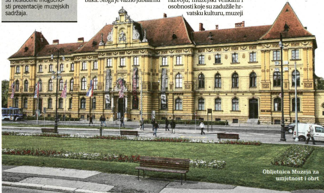
Obljetnica Muzeja za umjetnost i obrt

kao mjesta susreta i stjecanja novih znanja, odnos muzeja i lokalne zajednice, utjecaj muzeja u stvaranju pozitivnog javnog mijenja, muzeji i kulturne i kreativne industrije, muzeji i održivi razvoj kulturnog turizma, muzejska arhitektura i infrastruktura, novi muzeji, nove tehnologije i nova publika.